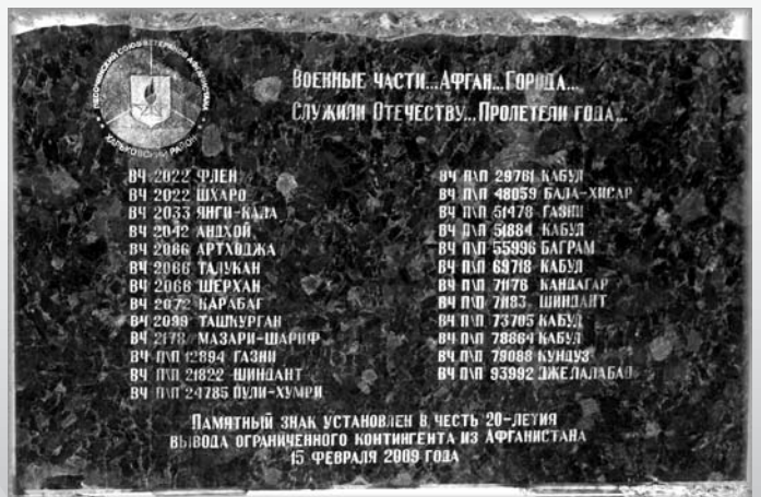
ХАРЬКОВСКИЙ ГОРОДСКОЙ СОЮЗ ВETERАНОВ АФГАНИСТАНА